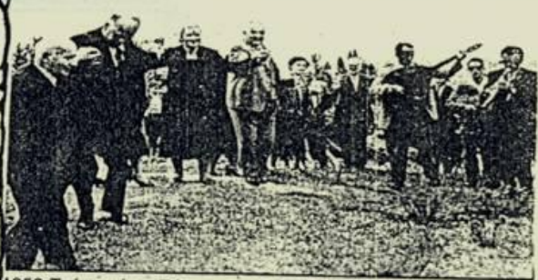
1959 Τρίτη μέρα Πάσχα στον Αηλιά. Οι Βελθεντινοί έστησαν το χορό γύρω από την εκκλησία